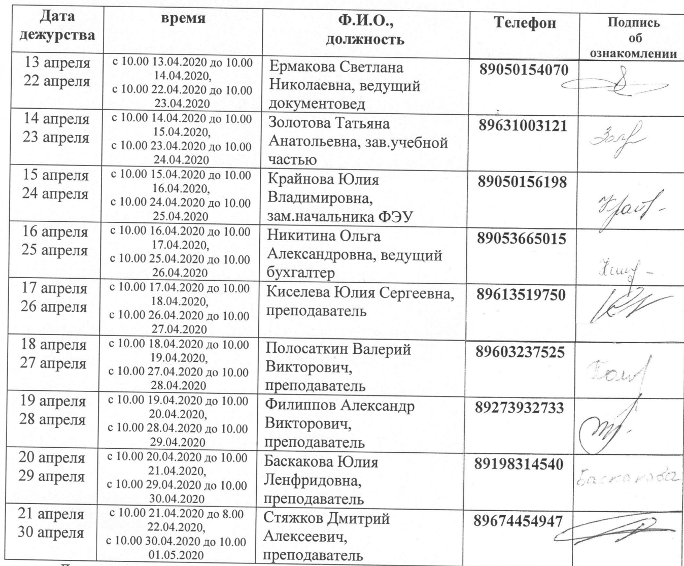
ГРАФИК ДЕЖУРСТВ с 13 апреля по 30 апреля 2020 года (Указ Президента РФ от 02.04.2020г. № 239)